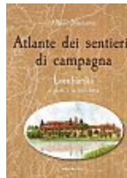
Albano Marcarini, Atlante dei sentieri di campagna. Lombardia a piedi e in bicicletta , Ediciclo, 156 pagine, 19,90 €

Nasce una nuova collana dedicata ai sentieri vicino alle metropoli. Il primo volume contiene 33 proposte nella campagna lombarda, dall'Adda di Leonardo ai boschi del Ticino, dalle limonaie del Garda alle marcite milanesi. Il libro è corredato da acquerelli e da indirizzi per trovare prodotti a chilometro zero e assaggiare le specialità locali nelle trattorie lungo i tragitti indicati.