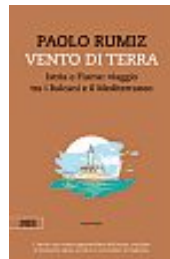
Paolo Rumiz, Vento di terra. Istria e Fiume: viaggio tra i Balcani e il Mediterraneo , Bottega Errante, 127 pagine, 14 €

A 26 anni dalla prima uscita, torna un'opera di uno dei viaggiatori più profondi e consapevoli del nostro tempo, Paolo Rumiz. È un reportage nell'Istria subito dopo il conflitto nell'ex Jugoslavia. Da rileggere, o leggere, per capire, di questa terra, "il suo millenario mimetismo. Il suo non essere di nessuno. Né italiana, né slovena, né croata. il suo essere "nostra"... Terra di coloro che la adottano, la abitano, la coltivano, la vivono". Un libro toccante.