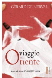
Gérard de Nerval, Viaggio in Oriente , edizioni Ares, 704 pagine, 24 €

Il poeta francese Gérard de Nerval (1808-1855) raccontò in un diario l'itinerario compiuto verso l'Oriente. Dall'uscita da Parigi all'arrivo in Grecia, dalla Turchia all'Egitto, il libro mescola realtà e mito, incontri e leggende, creando un immaginario di moschee, regine, emiri, magia. Le pagine dell'opera, nota nell'invito alla lettura Giuseppe Conte, sono "un flusso continuo, inarrestabile, di immagini, riflessioni, avventure, divagazioni, miti, storie sapienziali".